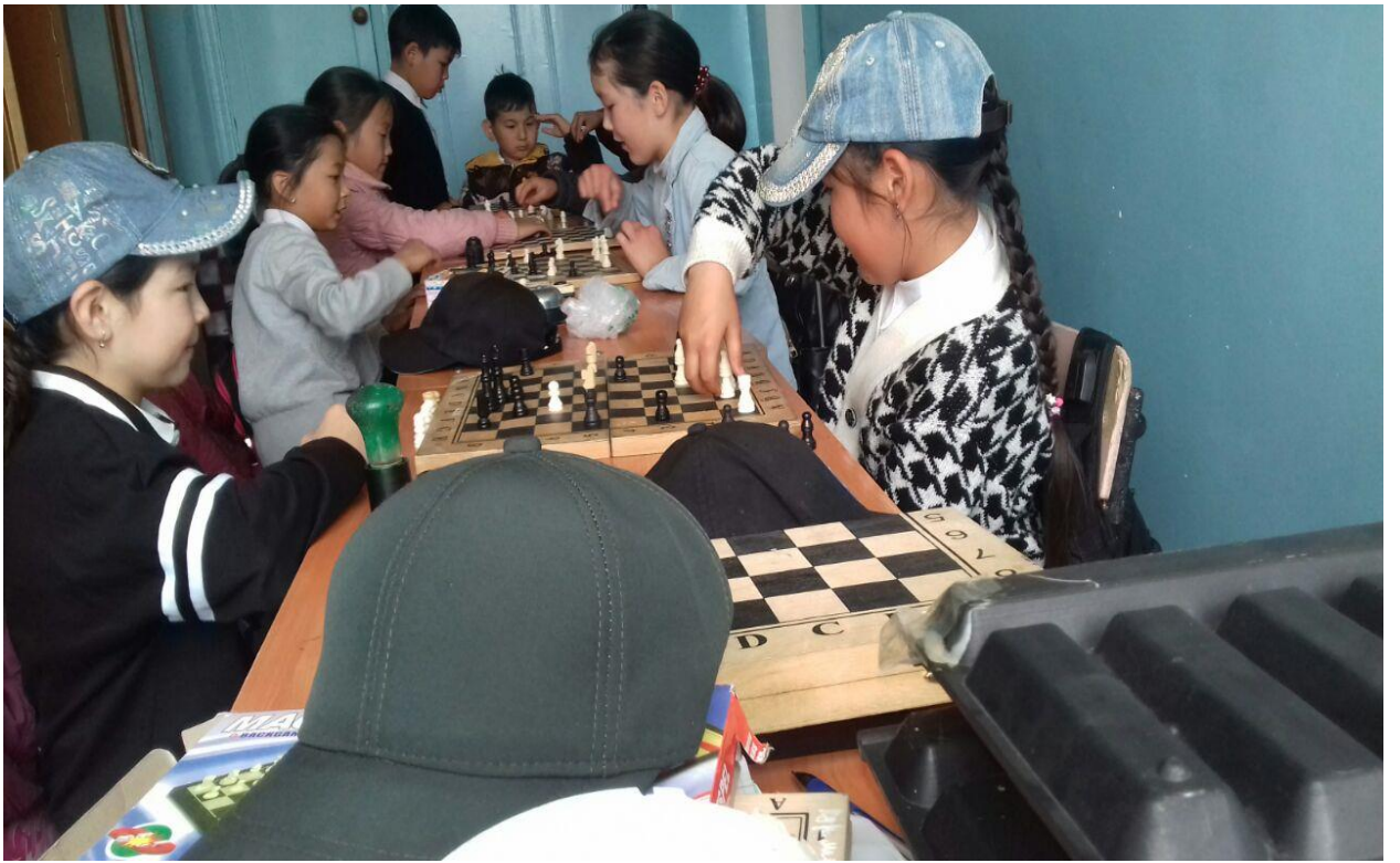
КЛУБ ТОГУЗ КОРГООЛ «АТ ӨТПӨС»